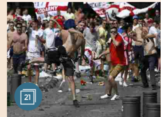
SPORT | 11 giugno 2016 Scontri a Marsiglia fra tifosi inglesi e polizia