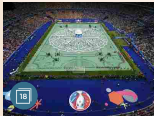
SPORT | 11 giugno 2016 Parigi, inaugurati allo Stade de France i Campionati europei di calcio