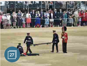
EUROPA | 11 giugno 2016 Elisabetta festeggia i 90 anni, una guardia sviene alla parata